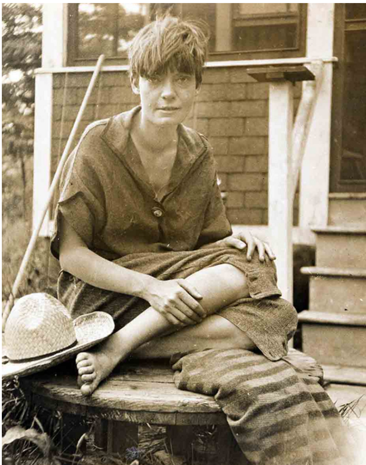
Дороти Дэй, 5 августа 1924 г.

В 1926 году произошло событие, изменившее всю её жизнь — рождение дочери Тамары. Это побудило Дороти искать духовного пристанища, и 28 декабря 1927 года она приняла крещение в Католической Церкви, что привело её к разрыву отношений с семьёй. Став католичкой, Дэй не отказалась от своих радикальных убеждений, а напротив, нашла в учении Церкви подтверждение необходимости социальной справедливости.