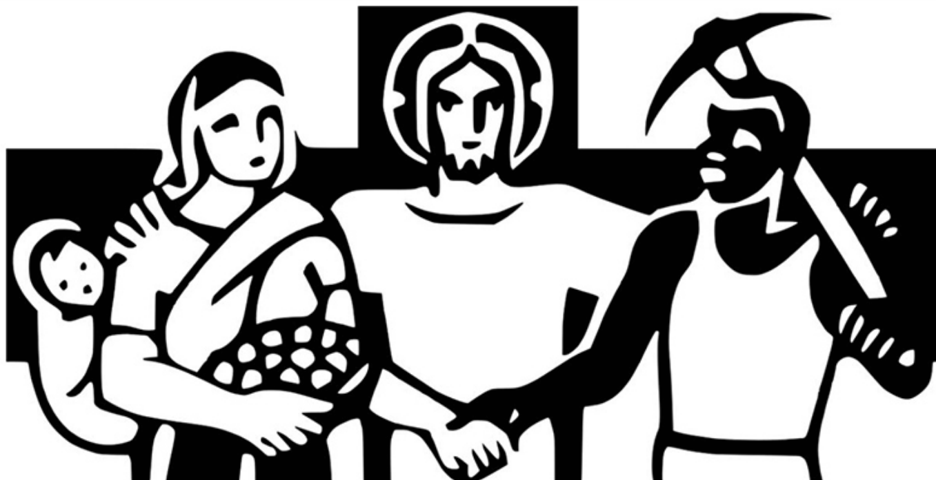
Логотип Движения католических рабочих

Малоизвестный факт биографии Дэй – она лично продавала газету на улицах Нью-Йорка. В своей автобиографии «The Long Loneliness» (1952) она писала, что продаёт газеты на улице, чтобы иметь возможность поговорить с людьми, услышать их истории, узнать об их нуждах.