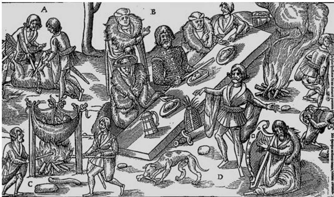
Джон Деррик. Вождь ирландского клана за обедом. Ок. 1581