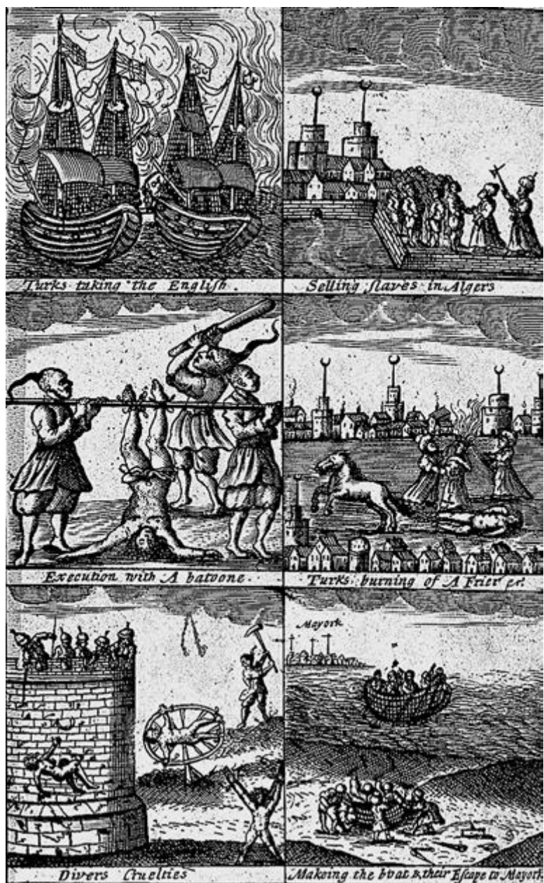
Иллюстрация из книги Уильяма Окли «Эбенезер, или Небольшой памятник Великому Милосердию» (Лондон, 1675). Подписи: Турки берут в плен англичан/Продают невольников в Алжире/Казнь через побивание палками/Турки сжигают монаха/Различные зверства/Изготовление лодки и побег на Майорку

Великолепную работу, отследив дальнейшую судьбу Болтиморских пленников, проделал Барнби.