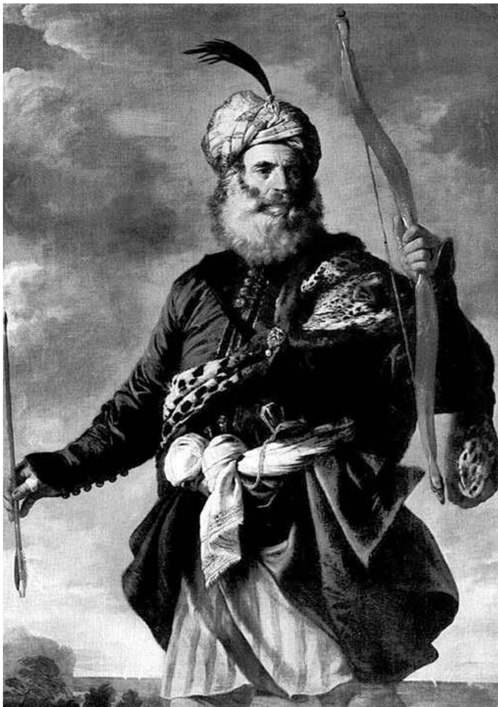
Пьер Франческо Мола. Восточный воин (Мурат-рейс). 1650

мореходом, в этом предприятии он отнюдь не являлся первопроходцем, в отличие от похода в Исландию. «Малыш Джон» Уорд несколько раз устраивал экспедиции к ирландским берегам, и мы также можем с уверенностью полагать, что он был не единственным корсаром, следовавшим по этому маршруту.