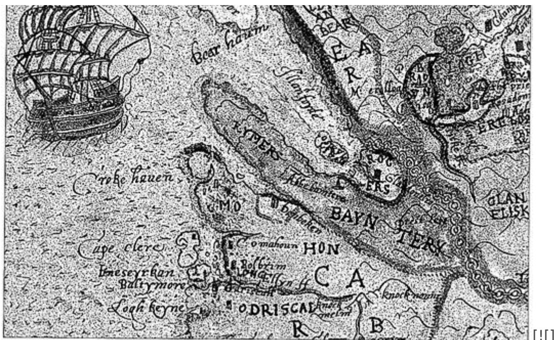
Юго-западное побережье Ирландии с городом Болтимор. Фрагмент карты Фрэнсиса Джобсона «Провинция Манстер». 1589

“ Два алжирских корабля направились на запад. Первым местом, где сообщалось, что их заметили с берега, был Каслхавен в пяти милях к востоку от Болтимора. Здесь видели, как они на закате дня миновали вход на якорную стоянку, однако их появление не вызвало тревоги. Едва начало темнеть, когда эти корабли бросили якоря у входа в гавань Болтимора. Сообщалось, что их точное местоположение было в одном мушкетном выстреле к юго-востоку от этого входа.