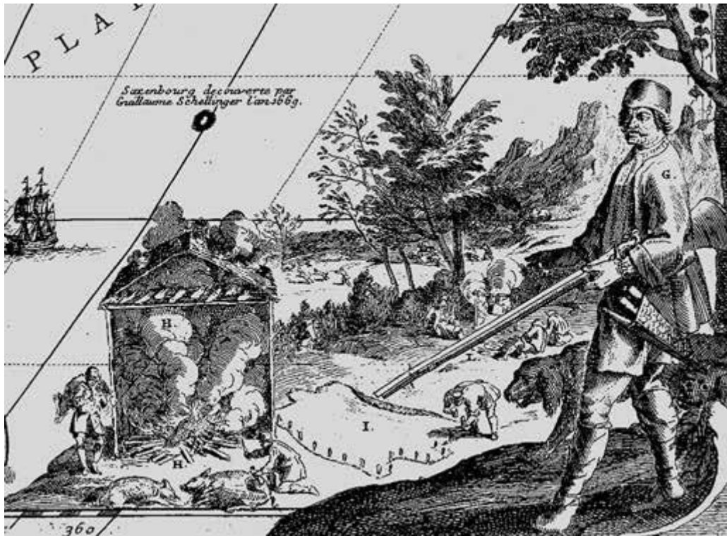
Буканьер и копчение мяса. Фрагмент карты Америки Николая де Фера. 1698

В конце XVII и начале XVIII века повсюду в мире начинают возникать независимые «пиратские утопии». Самой известной из них была Эспаньола, где буканьеры создали своё собственное недолговечное, весьма анархическое общество, Либертатия на Мадагаскаре, а также Нассау на Багамах, ставший последней классической пиратской утопией.