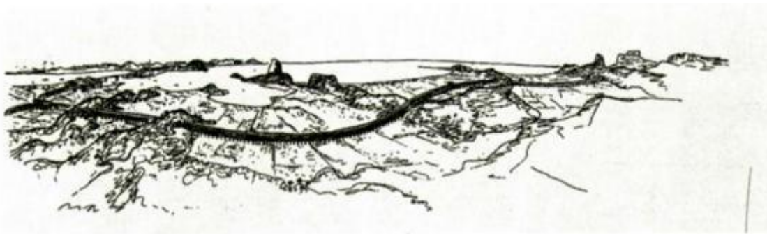
Рис. 16. План Ле Корбюзье дорог и жилых кварталов в Рио-де-Жанейро

Уже по своему размаху эти планы говорят сами за себя. Ле Корбюзье не идет ни на какой компромисс с уже существующим городом — новый городской пейзаж полностью вытесняет прежний. В каждом случае новый город имеет поразительные скульптурные свойства: он предназначен оказывать мощное визуальное воздействие своей формой. Стоит отметить, что это воздействие сказывается только на большом расстоянии. Буэнос-Айрес изображен так, как будто его рассматривают с расстояния многих миль с моря: вид Нового Света «после двухнедельного плавания», пишет Ле Корбюзье, принимая позу современного Христофора Колумба[260]. Рио-де-Жанейро виден как бы с высоты. Мы созерцаем шоссе в 6 км длиной, которое взбирается на сотню метров вверх и окаймлено непрерывной лентой пятнадцатизэтажных жилых домов. Новый город в буквальном смысле возвышается над