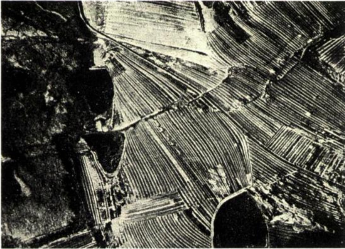
Рис. 17. Вид с воздуха на Альсаче, приблизительно 1930 г. Из книги Ле Корбюзье «Лучезарный город»

Формальная, геометрическая, простота и функциональная эффективность — это не две разные цели, которые нужно уравновесить; напротив, формальный порядок был для Ле Корбюзье предпосылкой функциональной эффективности. Он берет на себя задачу представления идеального индустриального города, в котором «общие истины», лежащие в основе века машин, были бы выражены с геометрической простотой. Суровость и единство этого идеального города требовали, чтобы он делал как можно меньше уступок истории существующих городов. «Мы даже в малом не должны уступать тому беспорядку, в котором мы находимся теперь, — писал он. — Там не может быть найдено никакого решения».