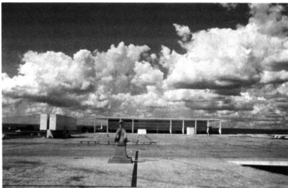
Рис. 22. Площадь Трех ветвей власти с городским музеем и дворцом Планальто, Бразилиа, 1980