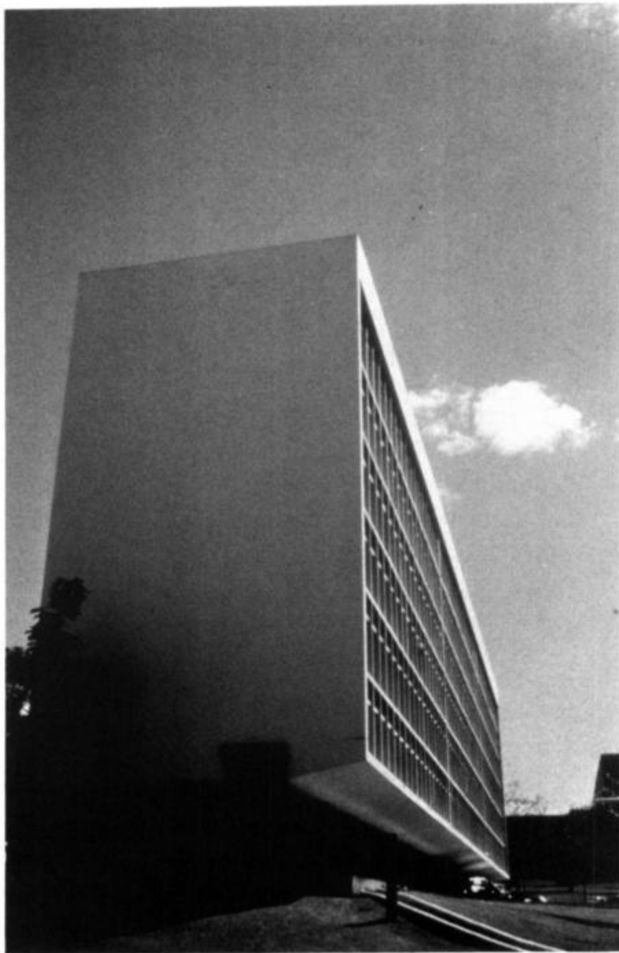
Рис. 26. Блок суперквадра в Бразилиа, 1980 г.

Анонимность, в которой вынужден жить каждый житель Бразилиа, очевидна уже из внешнего вида квартир, которые обычно составляют каждую жилую суперквадру (ср. рис. 25 и 26). Две наиболее частые жалобы жителей суперквадры — сходство квартир и изоляция мест жительства («в Бразилиа есть только дом и работа»)[320]. Строго геометрические фасады всех блоков одинаковы. Внешне нельзя отличить одну квартиру от другой; нет даже балконов, которые позволили бы жителям придать им какие-то отличительные черты и создать полуобщественные места. Отчасти эта дезориентация является результатом того, что местожительство, особенно такая его форма, не отвечает глубинным представлениям о доме как таковом. Холетон попросил целый класс девятилетних детей, большинство