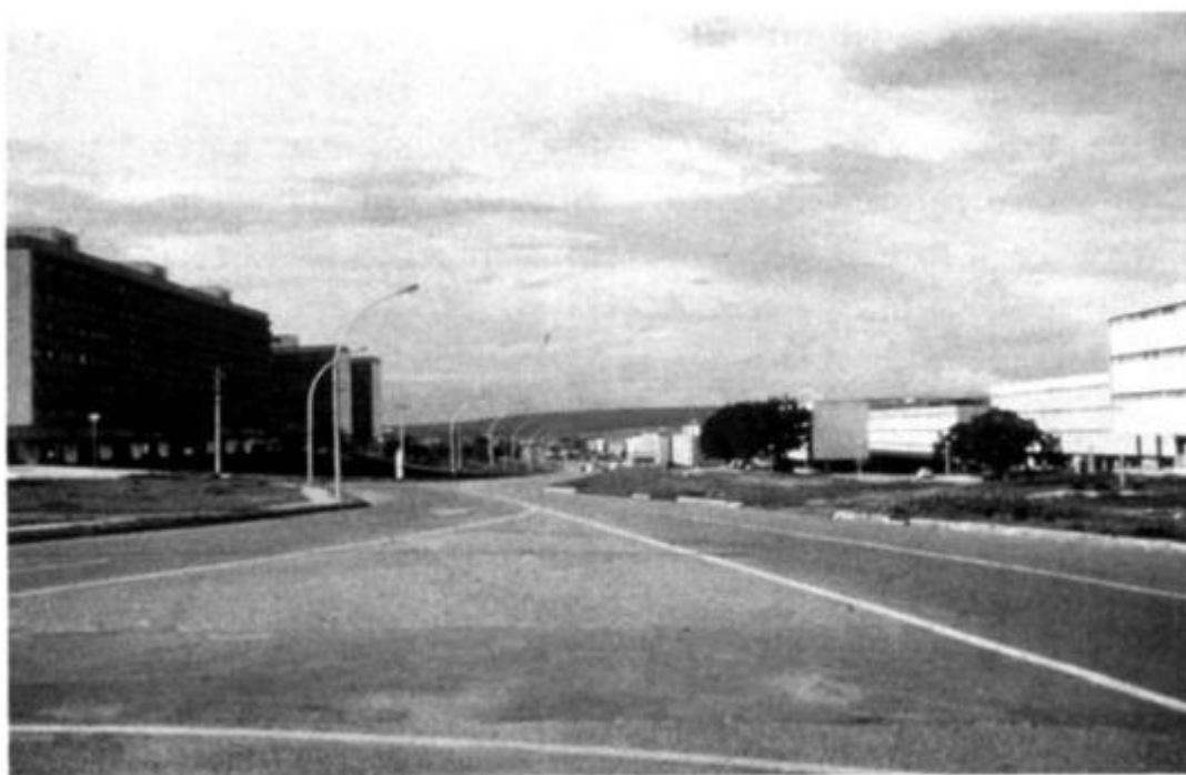
Рис. 20. Шоссе 1.1 в жилом районе Бразилиа, 1980