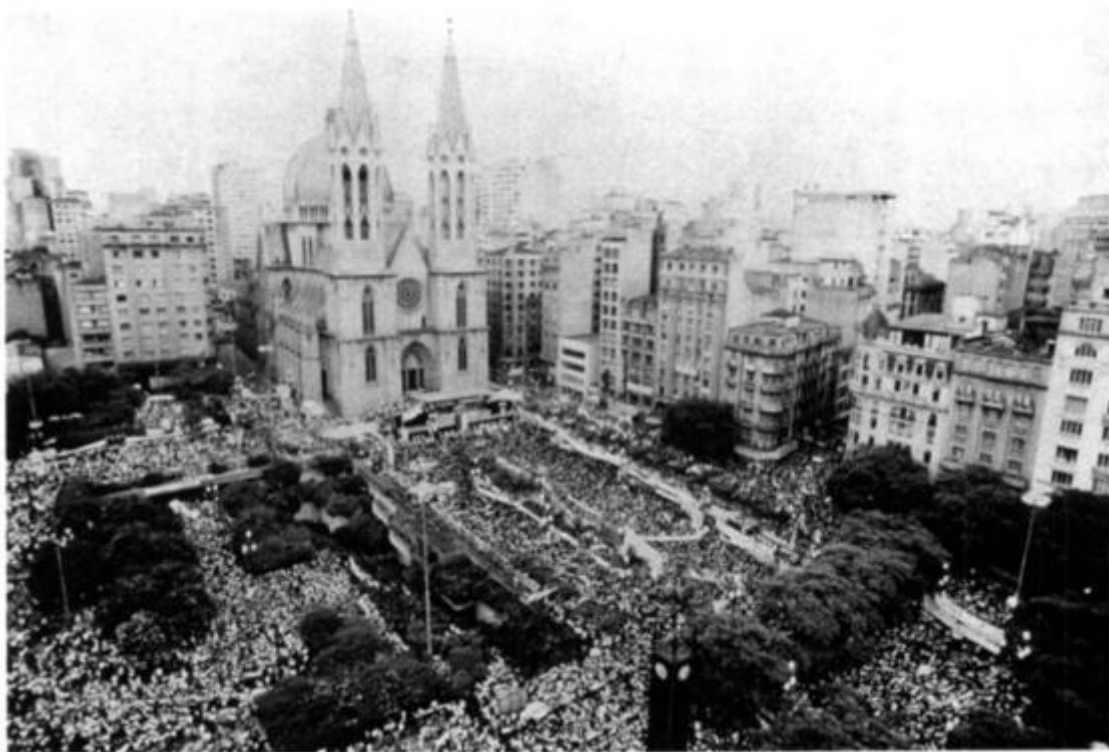
Рис. 23. Прага де Се, Сан-Паулу, 1984 г.