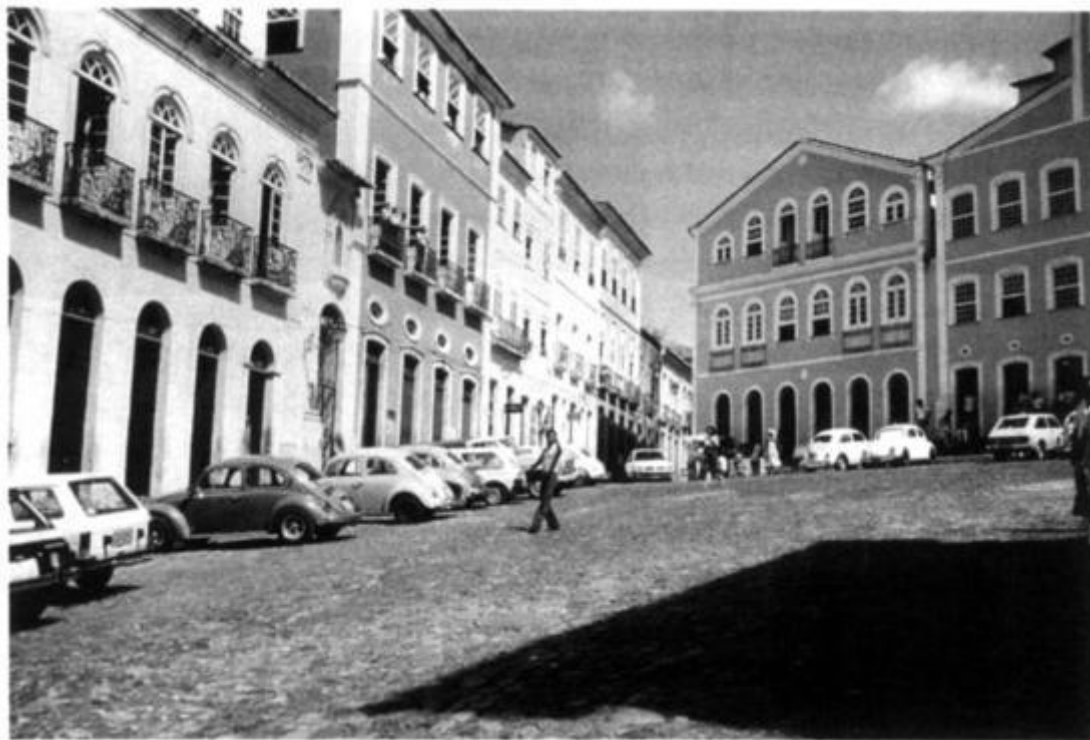
Рис. 21. Марго до Полуриньо, где расположены городской музей и бывший рынок рабов, Сан-Сальвадор, 1980