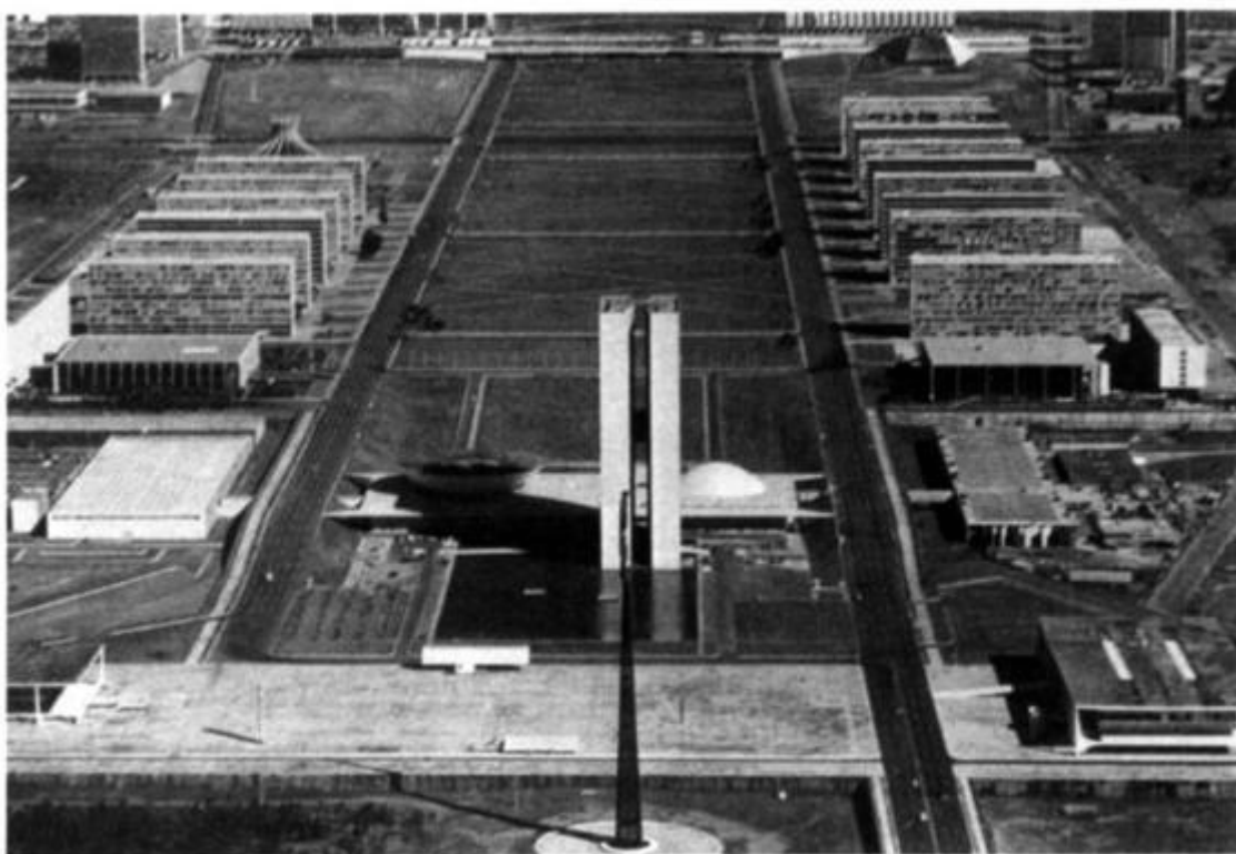
Рис. 24. Площадь Трех ветвей власти и эспланада министерств, Бразилиа, 1981 г.

Одна поразительная особенность городского пейзажа Бразилиа — официально обозначены фактически все общественные места в городе: стадион, театр, концертный зал, рестораны. Маленькие, неструктурированные, официально не запланированные общественные места —