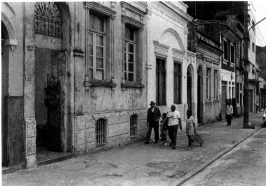
Рис. 19. Улица жилого района Барра Фундо, Сан-Паулу, 1988