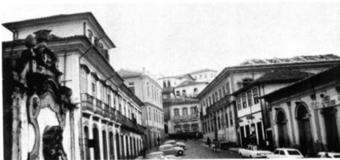
Рис. 25. Жилая зона на улице Тирадентес в Оуро-Прету, 1980 г.