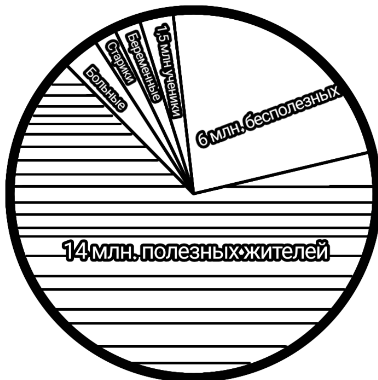
[Рис. 6. Распределение населения в вольном коммунизме. Трудятся те, кто может трудиться по справедливости. Полезных больше, чем бесполезных]

Избыток рабочей силы дает возможность сократить рабочий день на одного человека, обеспечить увеличение объема работ (строительство водохранилищ и орошение, облесение, увеличение посевов, увеличение производства стали и использование водопадов и т.д.) и увеличить производство в той или иной отрасли.