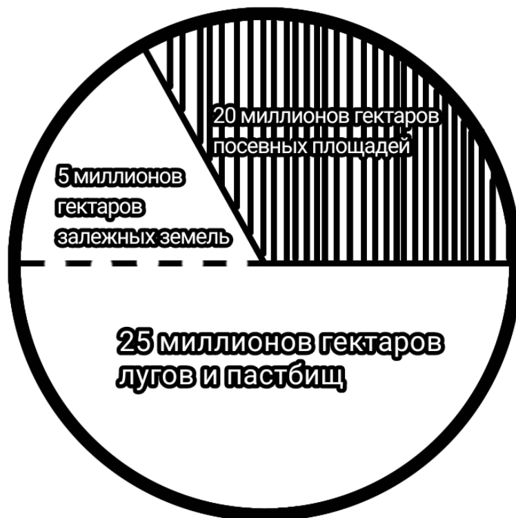
[рис 4. Распределение посевных площадей. 50 млн. гектаров]