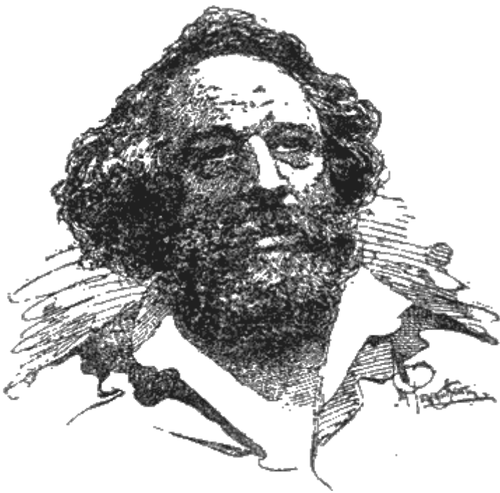
Михаил Бакунин (1814-1876)

Прим. переводчика: Брошюра эта написана в 1901 году.