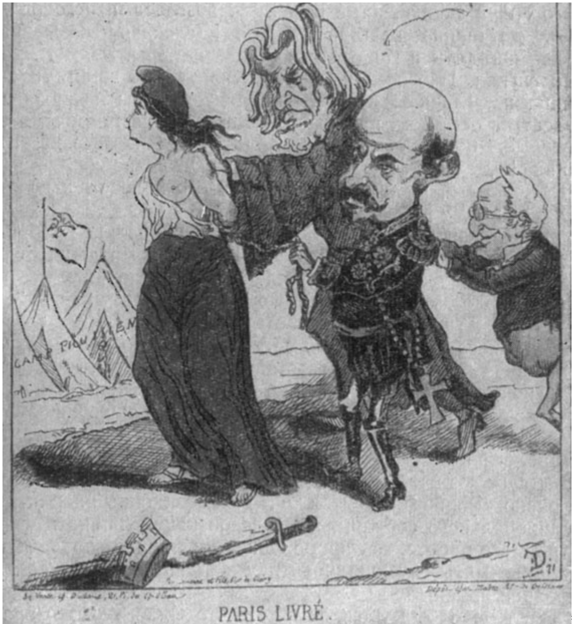
'Капитулянты' (Жюль Фавр, Трошю и Тьер выдают врагу связанную Францию)