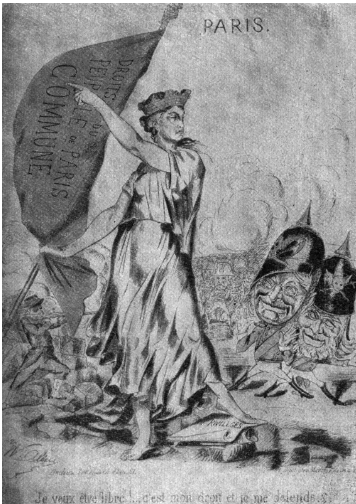
Первый плакат Коммуны

По предложению Франкеля, Коммуна учредила Высший финансовый комитет - орган, следивший за финансовым хозяйством бывших министерств и устанавливавший зарплату государственным служащим (не свыше 6 тысяч франков в год).