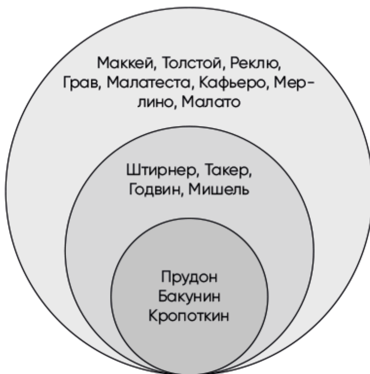
Рис. 1.1. Ранние оценки ведущих деятелей анархизма, внесших вклад в создание анархического канона

Хотя проведенный Ценкером анализ анархо-индивидуализма и анархо-коммунизма подчеркивает культурный и политический плюрализм движения, история развития социалистической мысли, представленная им и Шааком, оказалась довольно упрощенной. Шаак в значительной степени опирался на работы нью-йоркского профессора Ричарда Эли, но при этом не проявил присущей последнему беспристрастности. Эли наблюдал за распадом Первого интернационала и был знатоком европейского социализма. В своих наблюдениях он сформулировал ощущаемое многими противоречие между перспективой прогрессивных изменений и разрушительной силой движений, полных решимости их реализовать. Относясь к анархизму без предубеждений, Эли определил его как потенциально цивилизующую силу, способную разрушить «старые, отжившие институты» и «породить новую цивилизацию»[49]. Шаак же, напротив, анализируя развитие социализма в Западной Европе и его связь с анархизмом, разграничил этическую составляющую и фактические действия, как это стало принято после Французской революции.