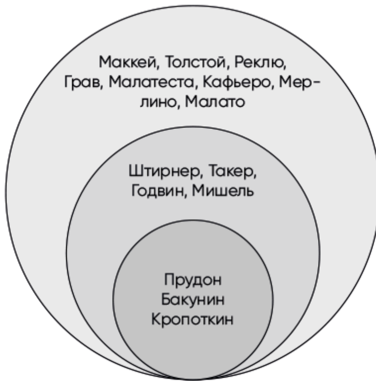
Рис. 1.1. Ранние оценки ведущих деятелей анархизма, внесших вклад в создание анархического канона

Хотя проведенный Ценкером анализ анархо-индивидуализма и анархо-коммунизма подчеркивает культурный и политический плюрализм движения, история развития социалистической мысли, представленная им и Шааком, оказалась довольно упрощенной. Шаак в значительной степени опирался на работы нью-йоркского профессора Ричарда Эли, но при этом не проявил присущей последнему беспристрастности. Эли наблюдал за распадом Первого интернационала и был знатоком европейского социализма. В своих наблюдениях он сформулировал ощущаемое многими противоречие между перспективой прогрессивных изменений и разрушительной силой движений, полных решимости их реализовать. Относясь к анархизму без предубеждений, Эли определил его как потенциально цивилизующую силу, способную разрушить «старые, отжившие институты» и «породить новую цивилизацию»[49]. Шаак же, напротив, анализируя развитие социализма в Западной Европе и его связь с анархизмом, разграничил этическую составляющую и фактические действия, как это стало принято после Французской революции.