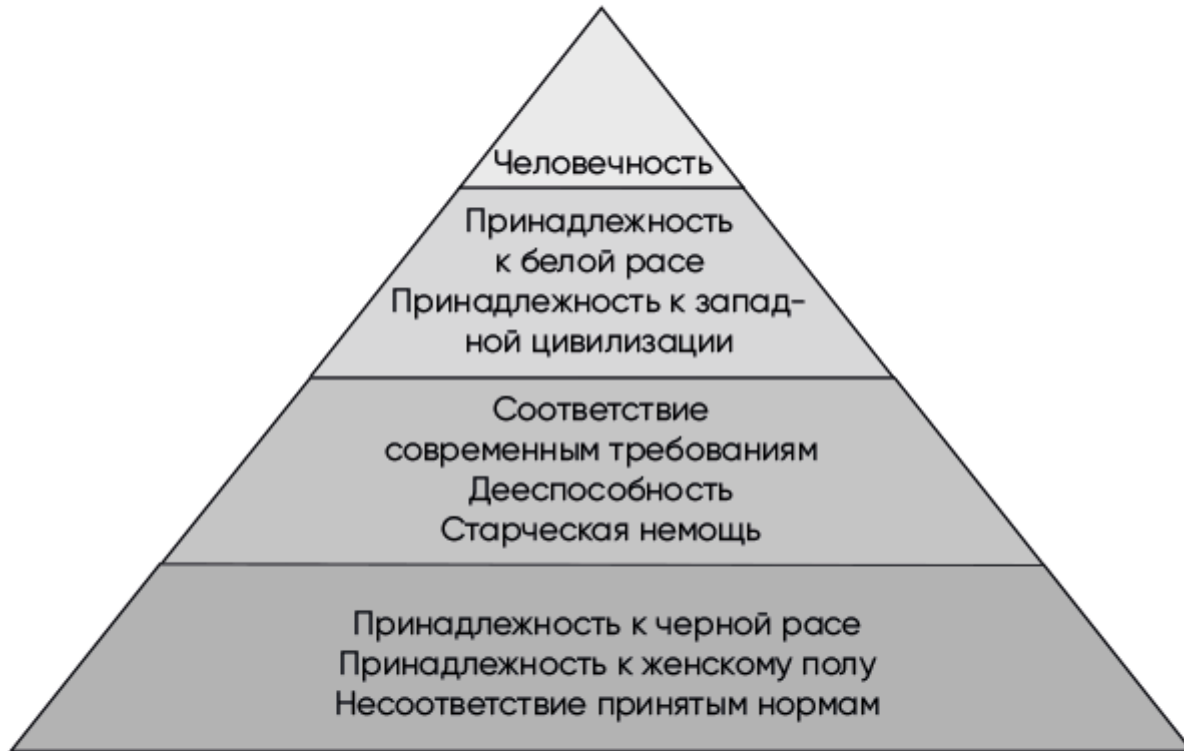
Рис. 3.5. Визуализация интерсекциональности, отображающая сложные иерархии угнетения, обусловленные происхождением, социальным статусом и привилегиями

Первичное квалицирование (умственные способности, физические данные) и предоставленные права (посвящения, инкорпорирование) создают многочисленные пересекающиеся притеснения