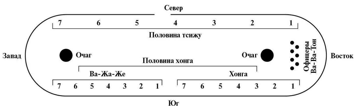
Расположение представителей кланов внутри помещения во время проведения важных ритуалов

Взято из: Fletcher A., La Flesche F. The Omaha tribe // Twenty-seventh Annual Report of the Bureau of American Ethnology, 1905–1906. Washington, DC: Bureau of American Ethnology, 1911; La Flesche F. War Ceremony and Peace Ceremony of the Osage Indians. Bureau of American Ethnology Bulletin 101. Washington: US Government, 1939.