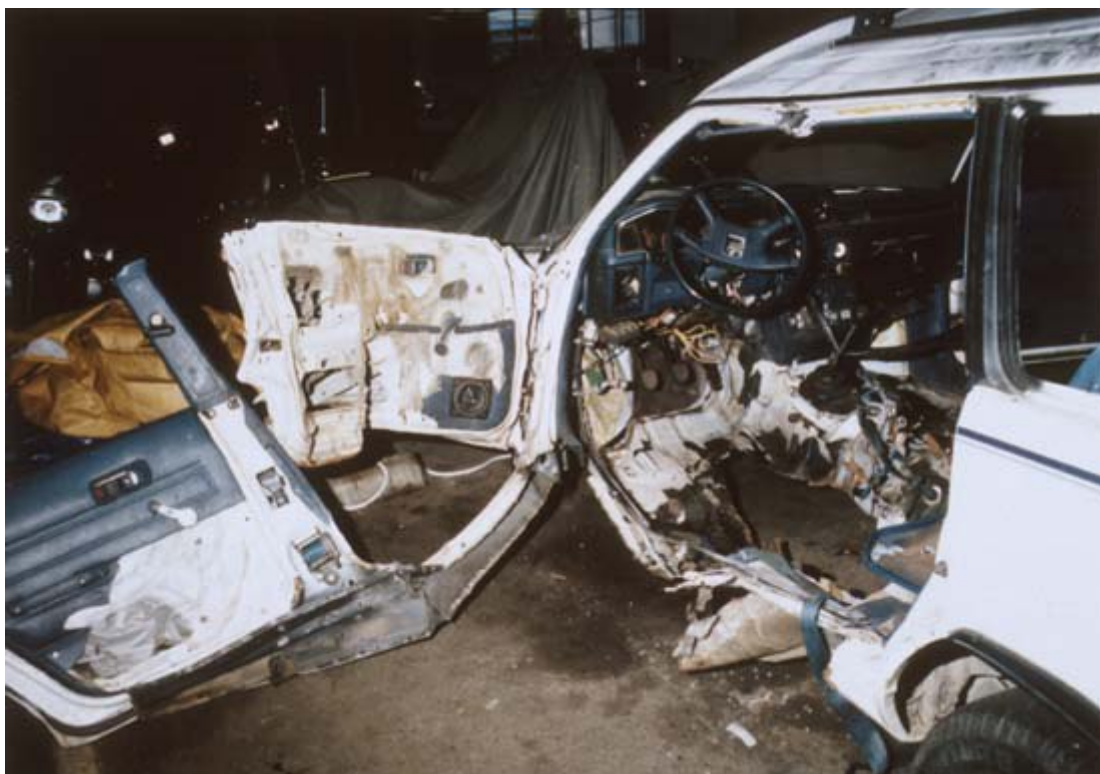
Взорванная машина после покушения, в которой ехали Джуди Бари и Деррил Черни

— Должны ли в этом участвовать коренные американцы, потому что они являются хранителями этой земли?