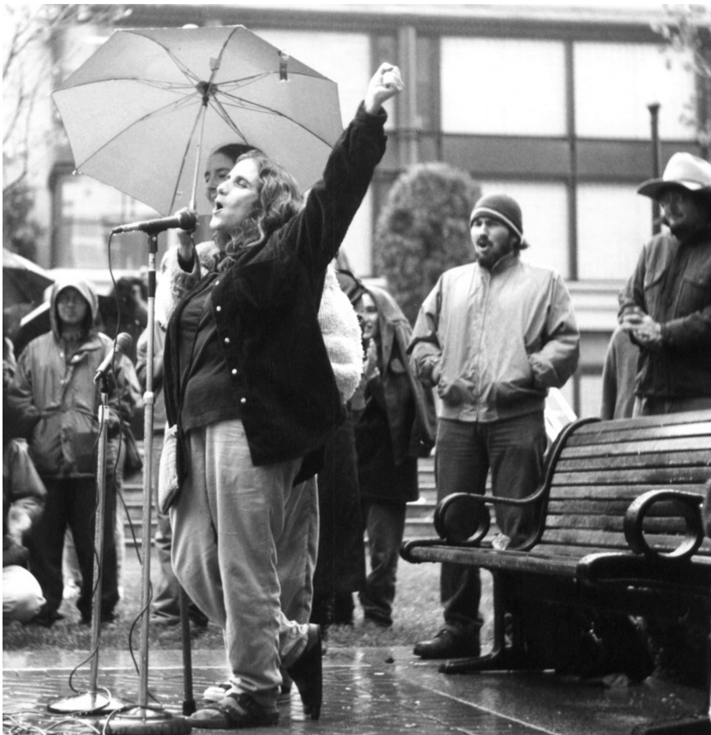
Выступление Джуди Бари

— Какие еще последствия имело «Лето Редвуда»?