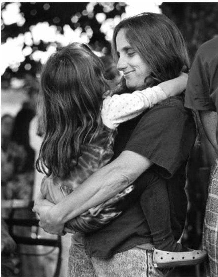
Джуди Бари с одной из дочерей

Возможно, поэтому это было так угрожающе. Женское движение угрожает мужской структуре власти. Точно так же, как черное движение угрожает белому.