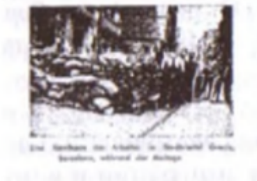
Die Katalonier haben die Freiheit erkämpft und die Faschisten abgeworfen. Die Arbeiter haben die Fabriken besetzt und die Regierung abgeworfen.

Ein freies Land - eine freiwirtschaftliche Revolution Die Katalonier haben die Freiheit erkämpft und die Faschisten abgeworfen. Die Arbeiter haben die Fabriken besetzt und die Regierung abgeworfen. Die Katalonier haben die Freiheit erkämpft und die Faschisten abgeworfen. Die Arbeiter haben die Fabriken besetzt und die Regierung abgeworfen.