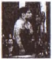
Die Katalonier haben die Freiheit erkämpft und die Faschisten abgeworfen. Die Arbeiter haben die Fabriken besetzt und die Regierung abgeworfen.

Die Katalonier haben die Freiheit erkämpft und die Faschisten abgeworfen. Die Arbeiter haben die Fabriken besetzt und die Regierung abgeworfen. Die Katalonier haben die Freiheit erkämpft und die Faschisten abgeworfen. Die Arbeiter haben die Fabriken besetzt und die Regierung abgeworfen.