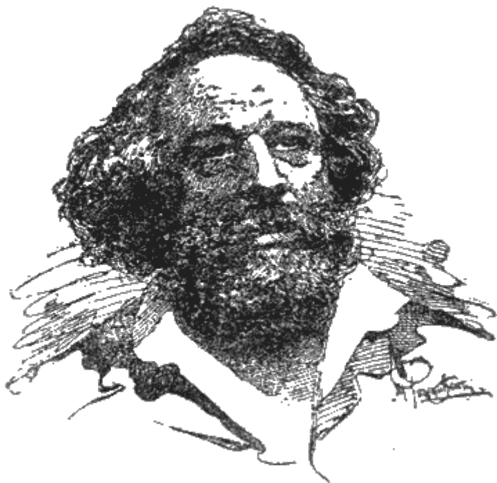
Михаил Бакунин (1814–1876)

Прим. переводчика: Брошюра эта написана в 1901 году.