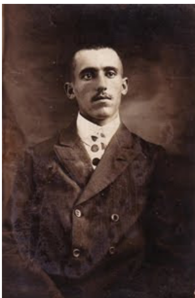
Симон Радовицкий в 17 лет

В Буэнос-Айресе Симон устраивается на работу механиком и присоединяется к группе русских эмигрантов-анархистов. В то время анархическое движение в Аргентине находилось в стадии роста, счет количества участников забастовок, организовываемых либертариями, шёл на сотни тысяч человек. Тираж ежедневной газеты анархистов «La Protesta Humana» в отдельных случаях достигал 60 тысяч экземпляров.