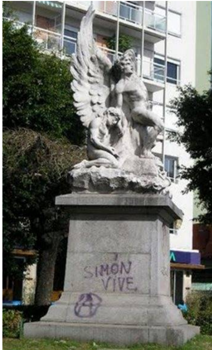
Памятник полковнику Симону Радовицкому в Буэнос-Айресе

Полковнику Рамону Фалькону в Аргентине установлены памятники и мемориальные доски, его именем названы улицы и полицейские академии. В 2003 году народная ассамблея, проходившая на Plaza Falcon, приняла решение переименовать её в площадь Симона Радовицкого.