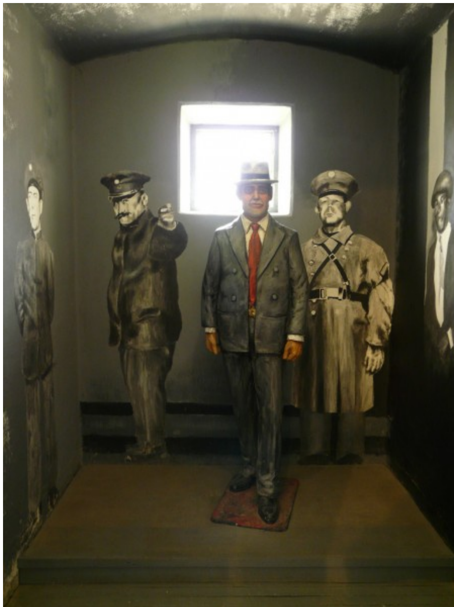
Инсталляция, изображающая Симона Радовицкого в его камере в тюрьме Ушуайя, ныне превращенной в музей

Своих действий Симон не отрицал, жертву из себя не изображал и на суде заявил, что убил Фалькона за содеянную им бойню против рабочих. Срок отбывал в тюрьме Ушуайя на острове Огненная Земля. Хотите представить себе климат этой местности? Оттуда отправляются круизы в Антарктиду. Холод, безжизненные степи и болота, снежные горы, бушующее море. Этап с Симоном прибыл туда в 1911 году, черные от угольной сажи люди, с кандалами на ногах.