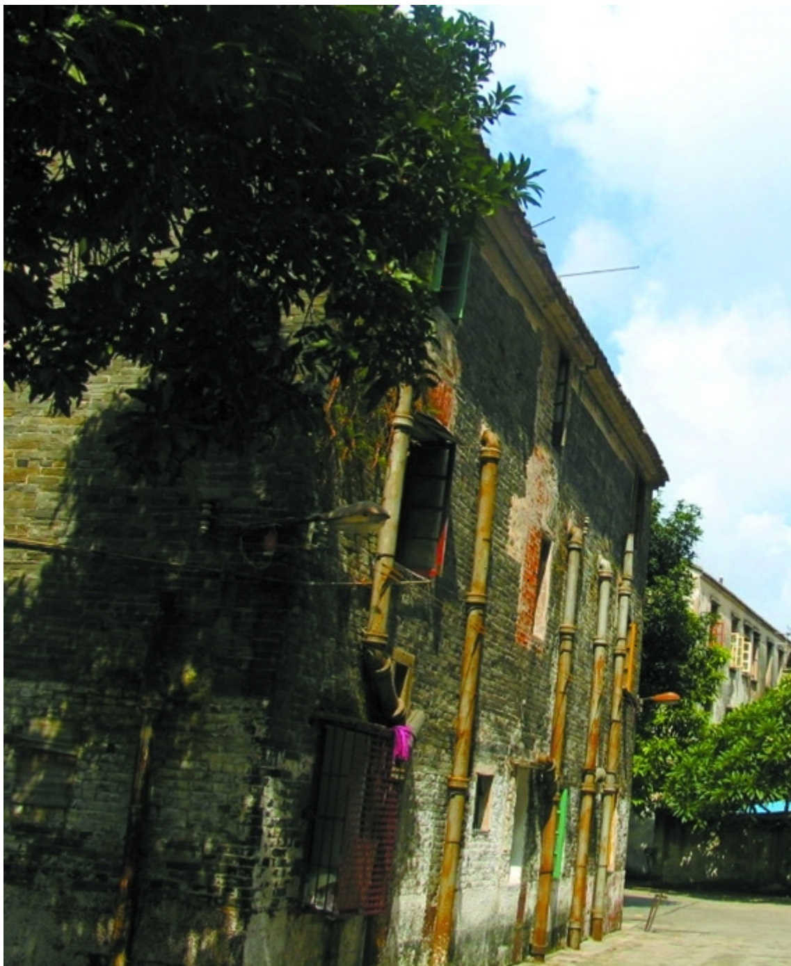
Дом, где родился Шифу

Настоящее имя Шифу было Лю Шаобинь. Родившись в 1884 году в городке Сяншань близ Кантона, он стал прекрасным классическим студентом, но черты революционера проявились в его характере еще до того, как он покинул Китай. В 1904 г. он отправился в Японию продолжать образование и в следующем году принял активное участие в организации суньятсеновского Объединенного союза. Однако Лю изучал не только академические науки. Он также постигал искусство изготовления взрывчатки, но, судя по дальнейшим событиям, не столь успешно.