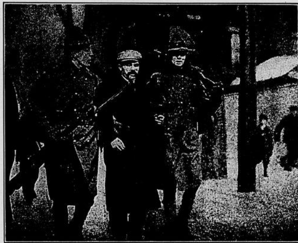
Арестованный забастовщики в сопровожденіи милиціонеров в Лауренсь.

Дѣло в том, что так — не стоит говорить крестьянам. Дѣло не в том, к чему в концѣ концов кто либо стремится, а в том, как сейчас, в данный момент осуществить какую либо потребность. Если уже предлагать что либо крестьянам, то надо предлагать прямо брать землю, объявляя и, при первой возможности, поддерживая их захваты. Правда, для этого нужны были предварительныя связи с крестьянами и задача революціонеров-рабочих завести эти связи заблаговременно. Крестьяне должны знать до начала социальной революціи, что прямой расчет заставляет