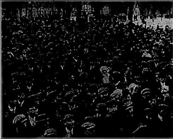
Забастовщики в Лауренсь.